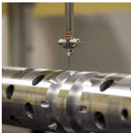
Eine Präzisionsmessmaschine überprüft die Maßhaltigkeit eines Hydraulikbauteils bis auf ein \mu (0,001 mm) genau.