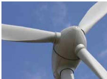
Hydraulikkomponenten und Spannwerkzeuge von König haben sich die unterschiedlichsten Einsatzgebiete erobert. Dazu zählen nicht nur Offshore-Plattformen, sondern z.B. auch Hersteller von Mobilhydrauliksystemen und Zulieferbetriebe für moderne Windkraftanlagen.

Insbesondere die internationale Luft- und Raumfahrtindustrie stellt extreme Anforderungen an Fertigungspräzision und Materialqualität. Aufgrund unserer fundierten Erfahrungen werden mit Königsdornen® auch Komponenten für Flugzeugtriebwerke produziert, die eine 0-Fehler-Toleranz aufweisen müssen.