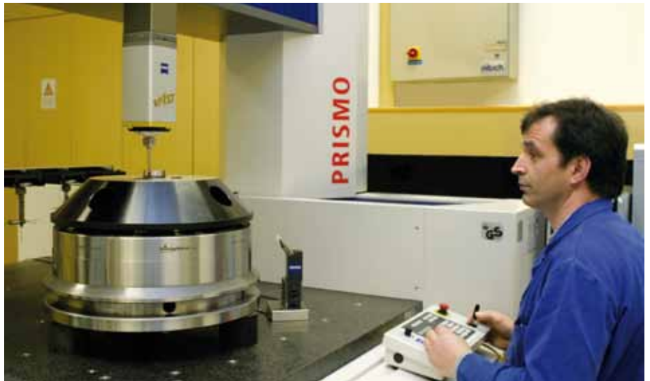
Ein Königdom® für die Fertigung von Flugzeugtriebwerken auf dem Prüfstand: Mit einer hochpräzisen Messmaschine wird die Genauigkeit des Spanndorns überprüft und dokumentiert.